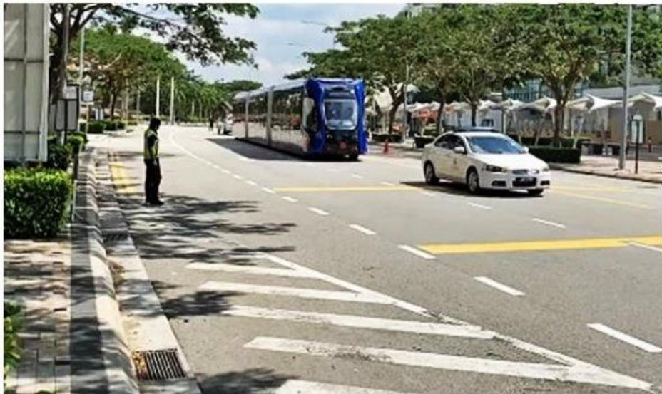
网民在公主港目击智轨电车在警车开路下，进行测试。

据了解，这辆智轨电车有三节车厢，以蓝色系为主，车身也写着“ART”，并且也标籤 (Hashtag) “不是普通巴士，我是电车”。