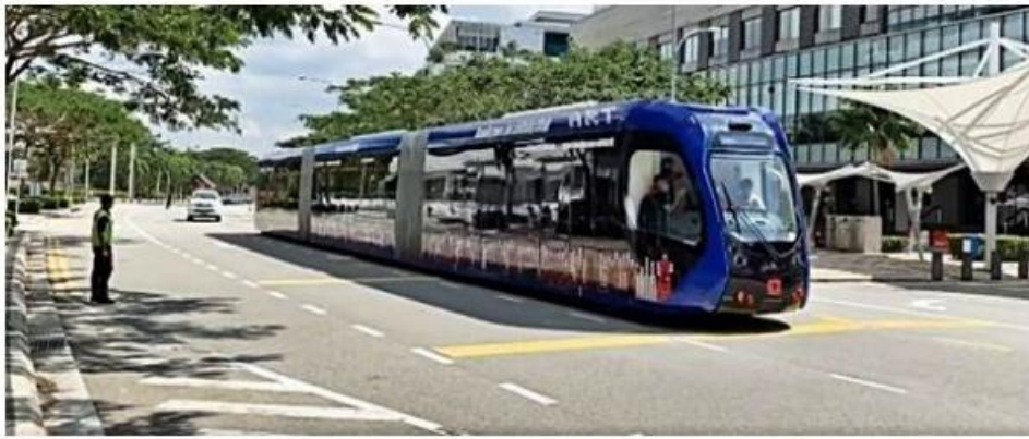
在公主港进行测试的智轨电车，拥有三节车厢。

(新山29日讯) 在参与伊斯干达快捷巴士系统4月份的测试前，一辆智轨电车 (ART) 意外现身伊斯干达城周围地区，令民众喜出望外，纷纷摄录视频分